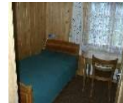
Zimmer mit 2 Einzelbetten