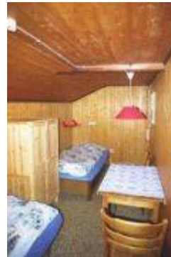
Zimmer mit 2 Einzelbetten