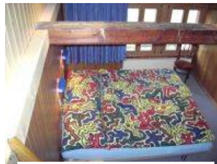
Zimmer mit Doppelbett